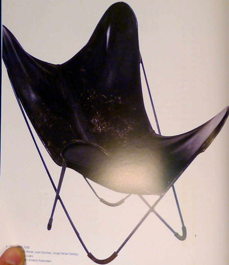
1.- Sillón BKF, 1938 Diseñado por Antonio Bonet, Juan Kurchan, Jorge Ferrari Hardoy. Hecho en cuero. Diseñado por Ernesto Katerstein Reproducido en Safari Museo de Arte Moderno de Buenos Aires por Bakkucchi